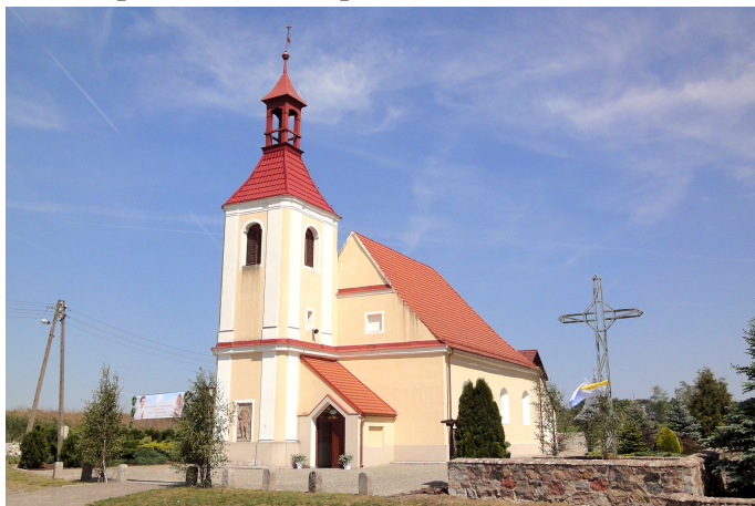
Zdjęcie nr 10. Kościół pw. św. Jana Nepomucena, Wilków