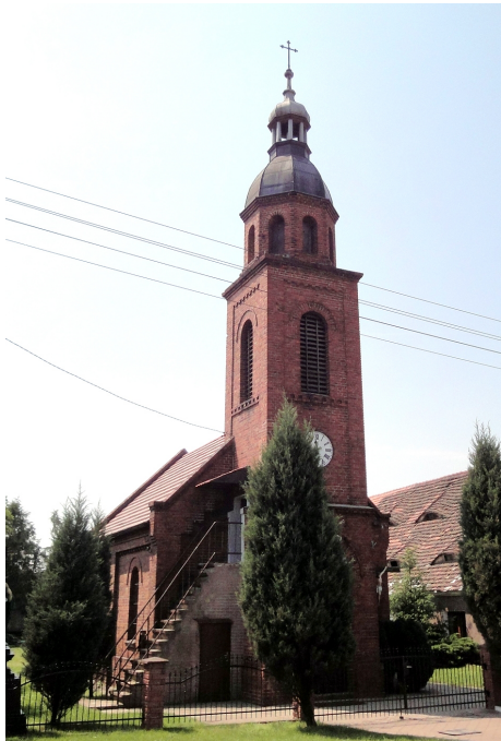
Zdjęcie nr 9. Kościół pw. Ducha Świętego, Grodziec Mały

Kościół ewangelicki, wzniesiony w 1900 r. Do lat 80-tych XX w. należał do parafii w Rapocinie, obecnie filialny parafii Wniebowzięcia NMP w Głogowie. Murowany z cegły, salowy, nakryty dwuspadowym dachem, z węższym i niższym prezbiterium – od płn.-wsch. i zakrystią przylegającą do prezbiterium od wsch. oraz z kwadratową wieżą wieńczącą kruchtę w fasadzie, dostępna po zewnętrznych schodach. Ostatnia kondygnacja wieży wieloboczna, w zwieńczeniu – pękaty hełm z ażurową latarnią. Ściany ujęte w ceglane podziały ramowe, z gzymsem kostkowym, okna zamknięte okragłolucznie.