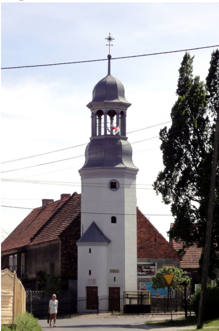
Zdjęcie nr 12. Kaplica – dzwonnica, Przedmoście