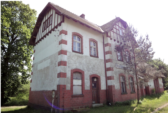
Zdjęcie nr 14. Dawny dworzec, ob. bud. mieszkalny, Wilków