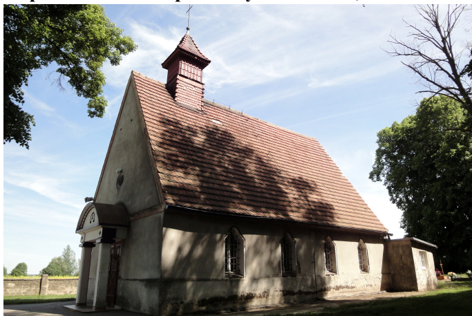
Zdjęcie nr 13. Kaplica cmentarna pw. Chrystusa Króla, Przedmoście

Kaplica cmentarna pw. Chrystusa Króla, Przedmoście , powstała w 1934 r.