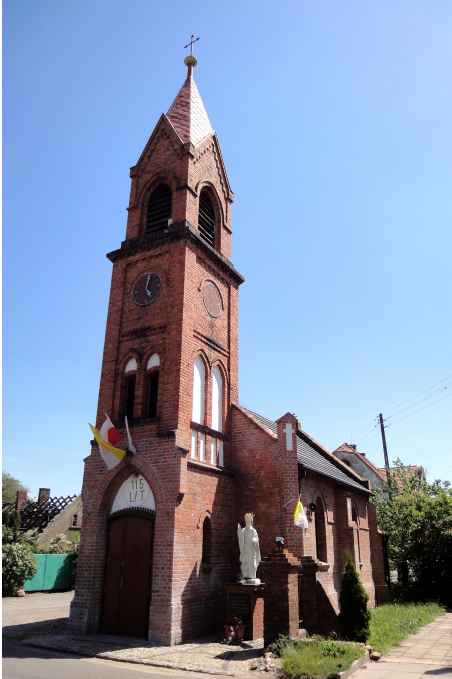
Zdjęcie nr 11. Kościół filialny pw. Narodzenia NMP, Szczyglice

Kościół filialny pw. Narodzenia NMP, Szczyglice, neogotycka, pochodzi z pocz. XIX w.