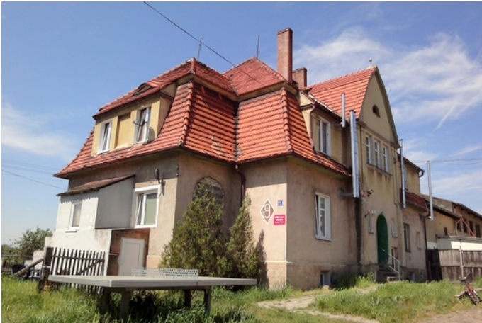
Zdjęcie nr 5. Świetlica wiejska w Serbach (nr 9)

Dworek w Starych Serbach nr 9 , tzw. dworek Pauli; wzniesiony wg proj. Karla Erbsta ze Szczecina, obecnie świetlica wiejska, data powstania: XIX/XX w.