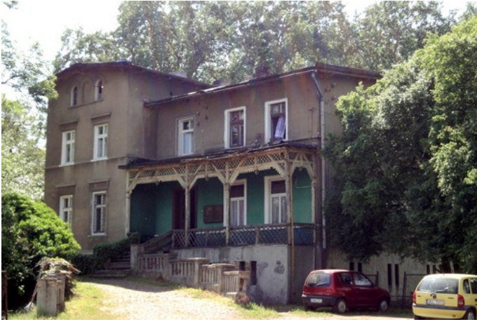
Zdjęcie nr 4. Dom zarządcy majątku w Wilkowie

Dom zarządcy majątku w Wilkowie , powstały na koniec XIX w., zachowane cechy stylowe.