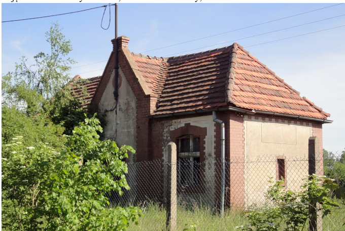
Zdjęcie nr 15. Stacja kolejowa Serby-Zachód, ob. budynek nieużytkowany, Serby