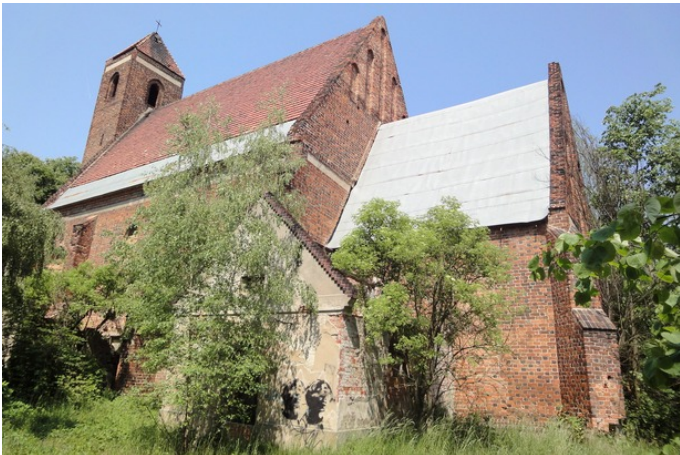
Zdjęcie nr 6. Kościół pw. św. Wawrzyńca, Rapocin