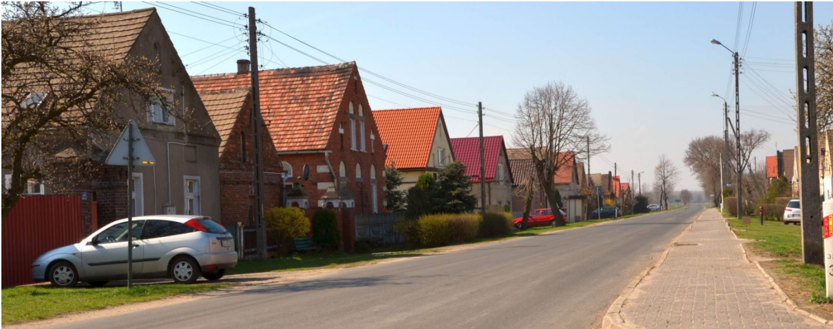
Zdjęcie nr 1. Zwarta zabudowa wsi Grodziec Mały, źródło: http://www.ugglogow.com.pl/index.php?option=com_content&view=article&id=217:grodziec-maly&catid=65&Itemid=175

Układ osadniczy gminy charakteryzuje się zwartością zabudowy, historycznie wykształconą strukturą osiedleńczą z miejscowościami o randze ośrodków dominujących i silnym powiązaniem z miastem Głogowem. W oddziaływaniu osadniczym miasta znajdują się wsie: Ruszowice oraz Serby. Droga krajowa nr 12 wpływa na miejscowości: Serby, Serby Stare, Wilków i Ruszowice. W tych ośrodkach najsilniej występują tendencje do rozwoju osadnictwa.