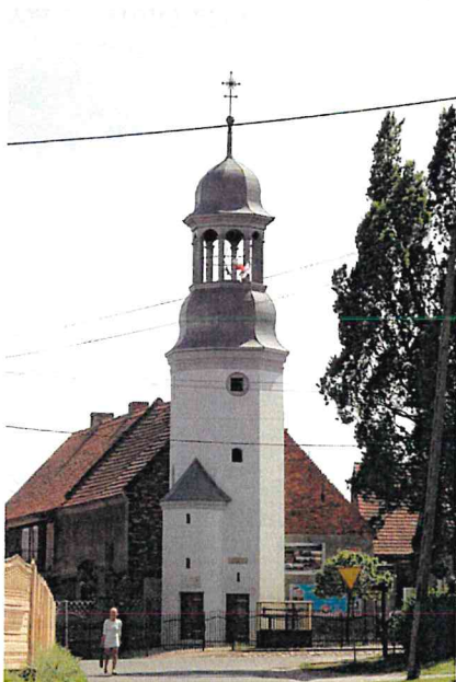
Zdjęcie nr 12. Kaplica – dzwonnica, Przedmoście