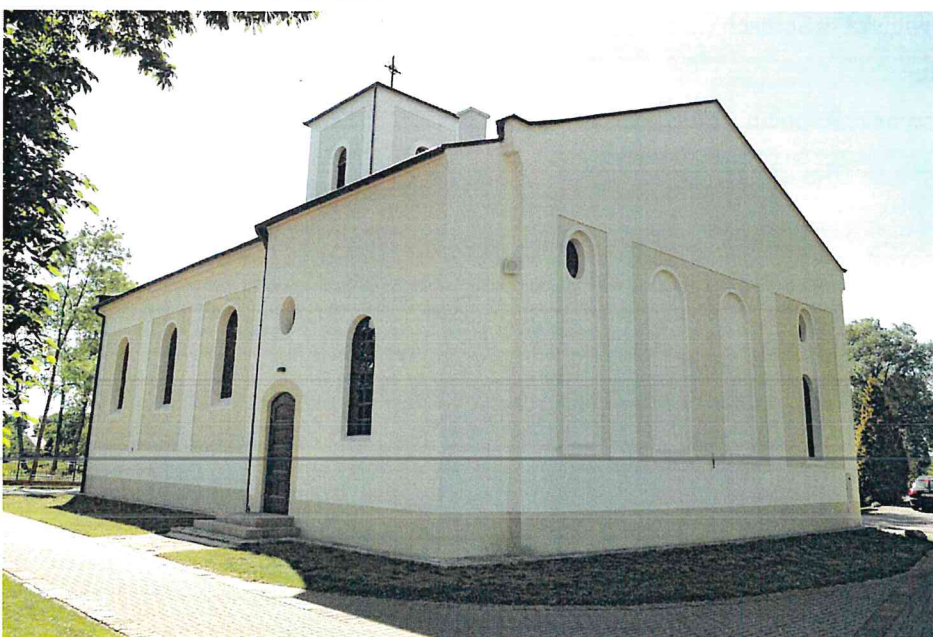
Zdjęcia 7, 8. Kościół pw. Św. Apostołów Piotra i Pawła, Serby

Kościół ewangelicki, wzniesiony w 1911 r. Zniszczony w 1945 r., odbudowany w nieco zmienionej formie w latach 1957-1959. Halowy, na rzucie prostokąta z aneksem dwukondygnacyjnej zakrystii