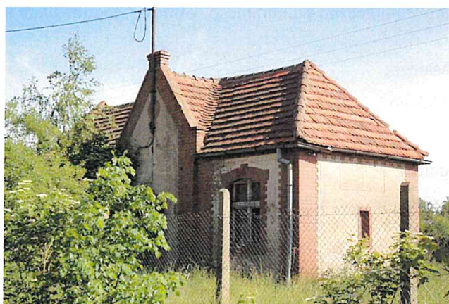
Zdjęcie nr 15. Stacja kolejowa Serby-Zachód, ob. budynek nieużytkowany, Serby