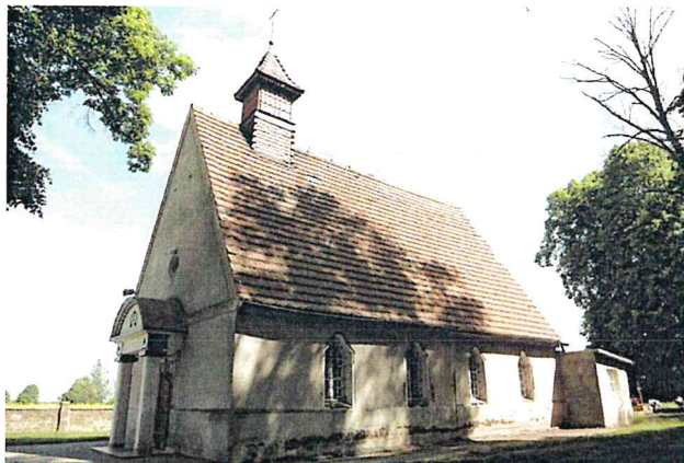
Zdjęcie nr 13. Kaplica cmentarna pw. Chrystusa Króla, Przedmoście

Kaplica cmentarna pw. Chrystusa Króla, Przedmoście, powstała w 1934 r.