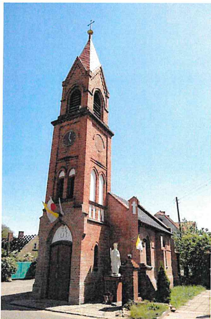
Zdjęcie nr 11. Kościół filialny pw. Narodzenia NMP, Szczyglice

Kościół filialny pw. Narodzenia NMP, Szczyglice, neogotycka, pochodzi z pocz. XIX w.