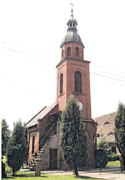
Zdjęcie nr 9. Kościół pw. Ducha Świętego, Grodziec Mały

Kościół ewangelicki, wzniesiony w 1900 r. Do lat 80-tych XX w. należał do parafii w Rapocinie, obecnie filialny parafii Wniebowzięcia NMP w Głogowie. Murowany z cegły, salowy, nakryty dwuspadowym dachem, z węższym i niższym prezbiterium – od płn.-wsch. i zakrystią przylegającą do prezbiterium od wsch. oraz z kwadratową wieżą wieńczącą kruchtę w fasadzie, dostępna po zewnętrznych schodach. Ostatnia kondygnacja wieży wieloboczna, w zwieńczeniu – pękaty hełm z ażurową latarnią. Ściany ujęte w ceglane podziały ramowe, z gzymsem kostkowym, okna zamknięte okrągłolucznie.