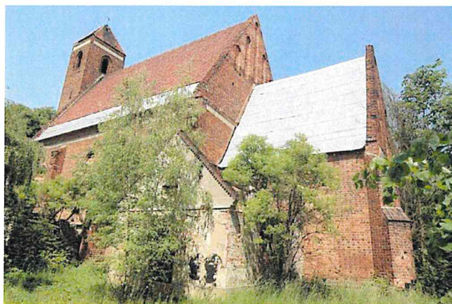
Zdjęcie nr 6. Kościół pw. św. Wawrzyńca, Rapocin