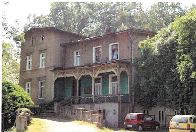
Zdjęcie nr 4. Dom zarządcy majątku w Wilkowie

Dom zarządcy majątku w Wilkowie , powstały na koniec XIX w., zachowane cechy stylowe.