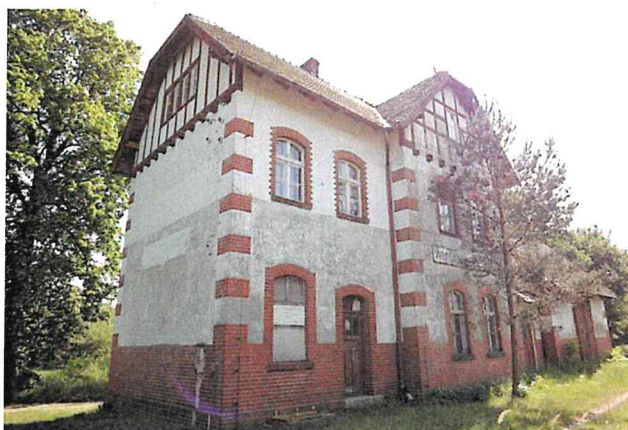
Zdjęcie nr 14. Dawny dworzec, ob. bud. mieszkalny, Wilków