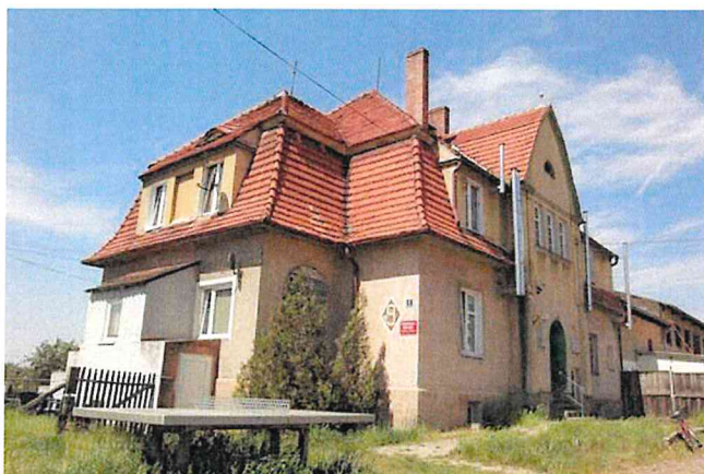
Zdjęcie nr 5. Świetlica wiejska w Serbach (nr 9)

Dworek w Starych Serbach nr 9 , tzw. dworek Pauli; wzniesiony wg proj. Karla Erbsta ze Szczecina, obecnie świetlica wiejska, data powstania: XIX/XX w.