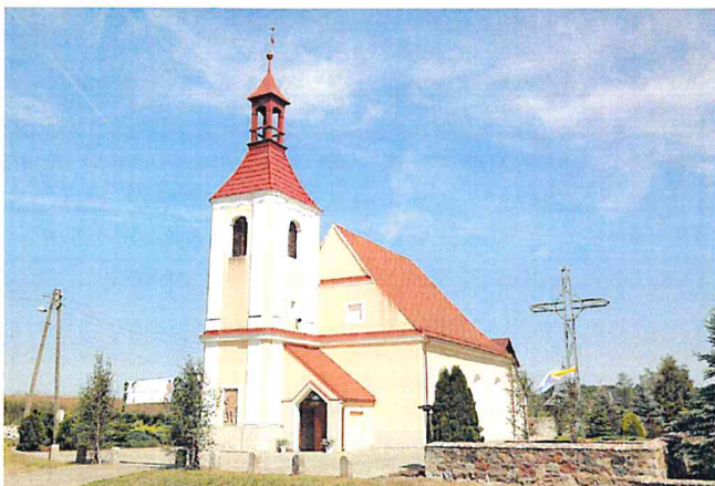
Zdjęcie nr 10. Kościół pw. św. Jana Nepomucena, Wilków