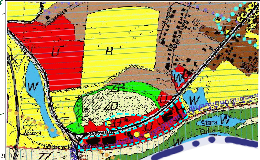
Obszar objęty opracowaniem planu