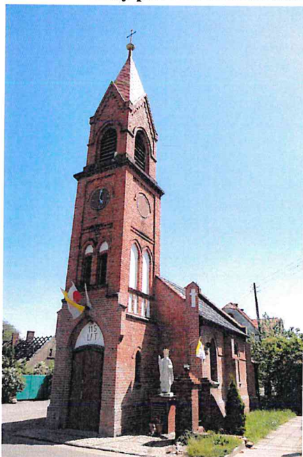
Zdjęcie nr 11. Kościół filialny pw. Narodzenia NMP, Szczyglice