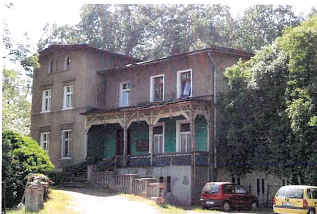
Zdjęcie nr 4. Dom zarządcy majątku w Wilkowie

Dom zarządcy majątku w Wilkowie , powstały na koniec XIX w., zachowane cechy stylowe.