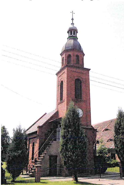
Zdjęcie nr 9. Kościół pw. Ducha Świętego, Grodziec Mały

Kościół ewangelicki, wzniesiony w 1900 r. Do lat 80-tych XX w. należał do parafii w Rapocinie, obecnie filialny parafii Wniebowzięcia NMP w Głogowie. Murowany z cegły, salowy, nakryty dwuspadowym dachem, z węższym i niższym prezbiterium – od płn.-wsch. i zakrystią przylegającą do prezbiterium od wsch. oraz z kwadratową wieżą wieńczącą kruchtę w fasadzie, dostępna po zewnętrznych schodach. Ostatnia