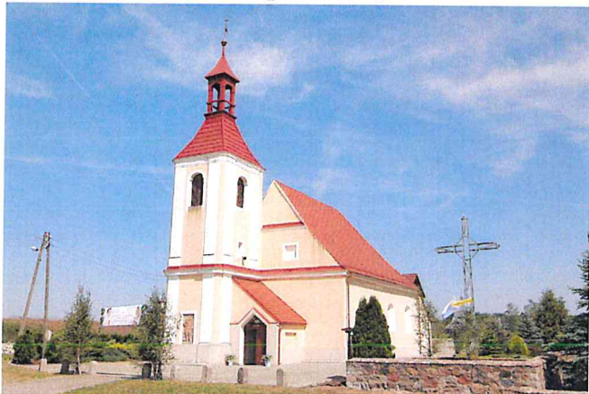
Zdjęcie nr 10. Kościół pw. św. Jana Nepomucena, Wilków