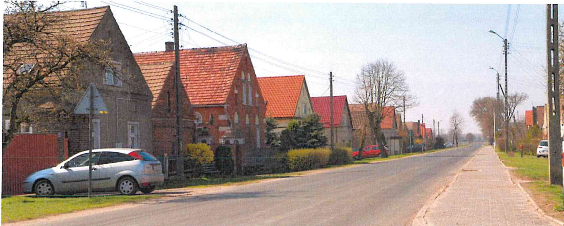
Zdjęcie nr 1. Zwarta zabudowa wsi Grodziec Mały, źródło: http://www.ugglogow.com.pl/index.php?option=com_content&view=article&id=217:grodziec-maly&catid=65&Itemid=175

Układ osadniczy gminy charakteryzuje się zwartością zabudowy, historycznie wykształconą strukturą osiedleńczą z miejscowościami o randze ośrodków dominujących i silnym powiązaniem z miastem Głogowem. W oddziaływaniu osadniczym miasta znajdują się wsie: Ruszowice oraz Serby. Droga krajowa nr 12 wpływa na miejscowości: Serby, Serby Stare, Wilków i Ruszowice. W tych ośrodkach najsilniej występują tendencje do rozwoju osadnictwa.