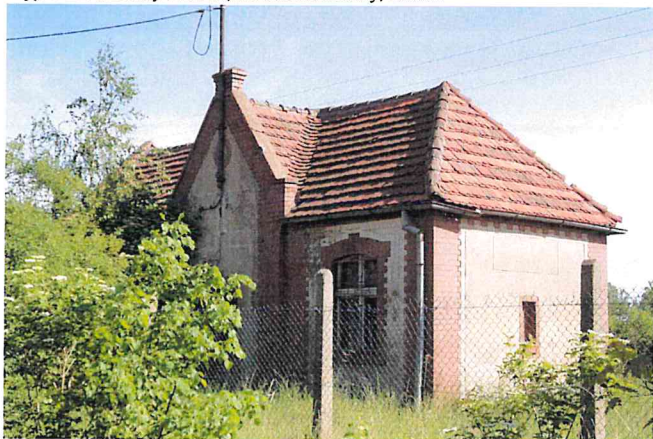
Zdjęcie nr 15. Stacja kolejowa Serby-Zachód, ob. budynek nieużytkowany, Serby