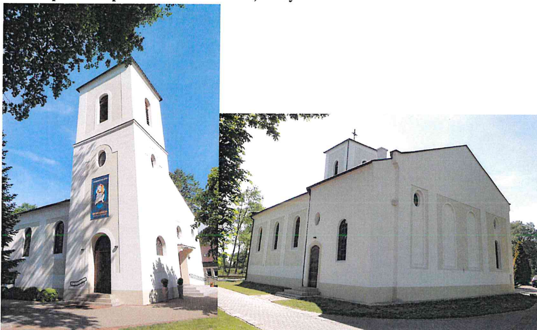
Zdjęcia 7, 8. Kościół pw. Św. Apostołów Piotra i Pawła, Serby

Kościół ewangelicki, wzniesiony w 1911 r. Zniszczony w 1945 r., odbudowany w nieco zmienionej formie w latach 1957-1959. Halowy, na rzucie prostokąta z aneksem dwukondygnacyjnej zakrystii i prostokątną, trójkondygnacyjną wieżą – usytuowanymi niesymetrycznie, w przeciwległych narożach korpusu. Ściany tynkowane fakturalnie, z gładko tynkowanymi podziałami ramowymi. Okna zamknięte łukiem okrągłym. Dach główny czterospadowy, dach wieży namiotowy.