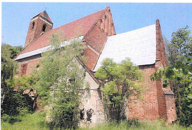
Zdjęcie nr 6. Kościół pw. św. Wawrzyńca, Rapocin

Kościół w Rapocinie to najcenniejszy zabytek gminy. Wzmiankowany w 1297 r., obecny pochodzi z przełomu XIV/XV w. Orientowany budynek jednonawowy z wieżą od zach., z prostokątnym prezbiterium, do którego przylega od płu. zakrystia (1896 r.), od pld. – kaplica, a do nawy kruchta wejściowa. Prezbiterium i zakrystia nakryte sklepieniami kolebkowymi, nawa – stropem. Ambona i ołtarze (1901 r.) – rzeźbiarz głogowski Jäkel, organy – firma Schlag i synowie. Kościół był wielokrotnie remontowany i odnawiany: 1791 r., 1849 r. W czasie II wojny spalony, został odbudowany w latach 1967-1968 i działał do 1988 r. Po wysiedleniu wsi Rapocin, kościół został zabezpieczony, a otwory zamurowane. Z czasem zabezpieczenia zostały usunięte, dach został częściowo rozebrany, co prowadzi do dewastacji świątyni. Obiekt popada w całkowitą ruinę, zachowały się gotyckie okna, portale i blendy w prezbiterium.