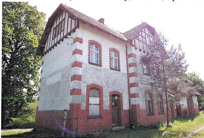
Zdjęcie nr 14. Dawny dworzec, ob. bud. mieszkalny, Wilków