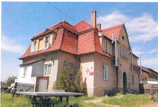
Zdjęcie nr 5. Dworek w Starych Serbach nr 9

Dworek w Starych Serbach nr 9 , tzw. dworek Pauli; wzniesiony wg proj. Karla Erbsta ze Szczecina, ob. świetlica wiejska, data powstania: XIX/XX w.