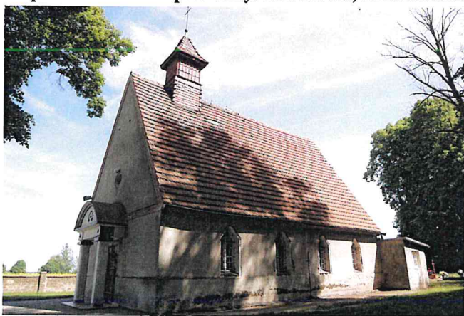
Zdjęcie nr 13. Kaplica cmentarna pw. Chrystusa Króla, Przedmoście

Kaplica cmentarna pw. Chrystusa Króla, Przedmoście, powstała w 1934 r.