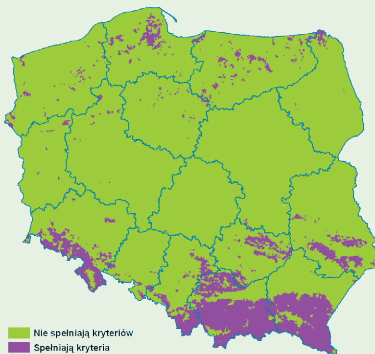
Ryc. 1. Wykaz obszarów zagrożonych erozją wodną