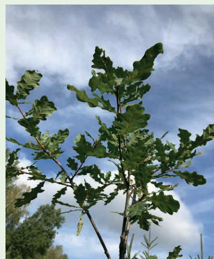
fol. E. Budka

Celem planu zalesienia jest wyposażenie rolnika w fachową informację na temat wykonania zalesienia oraz zabiegów pielęgnacyjnych na założonej uprawie leśnej lub gruntach z sukcesją naturalną, które mają być wykonywane przez 5 lat. Plan zalesienia sporządzany jest oddzielnie dla każdego kompleksu obejmującego grunty przeznaczone do wykonania zalesienia lub grunty z sukcesją naturalną i powinien zawierać podpis nadleśniczego, który sporządził ten plan. Jego egzemplarz powinien być przechowywany u rolnika, a kopia w Nadleśnictwie. Ponadto, kopia planu zalesienia (potwierdzona za zgodność z oryginałem przez nadleśniczego, który sporządził ten plan) dołączana jest do wniosku o przyznanie wsparcia na zalesienie lub do wniosku o przyznanie pierwszej premii pielęgnacyjnej do gruntów z sukcesją naturalną na których, zgodnie z planem zalesienia nie jest wymagane dolesienie.