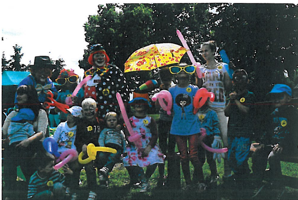
Dzień dziecka 2013r.