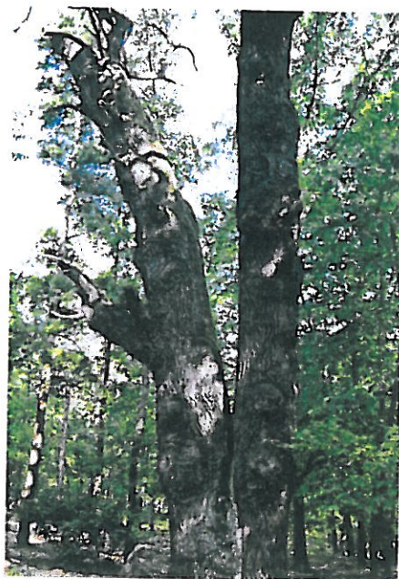
Dąb w Zagajniku Elisy