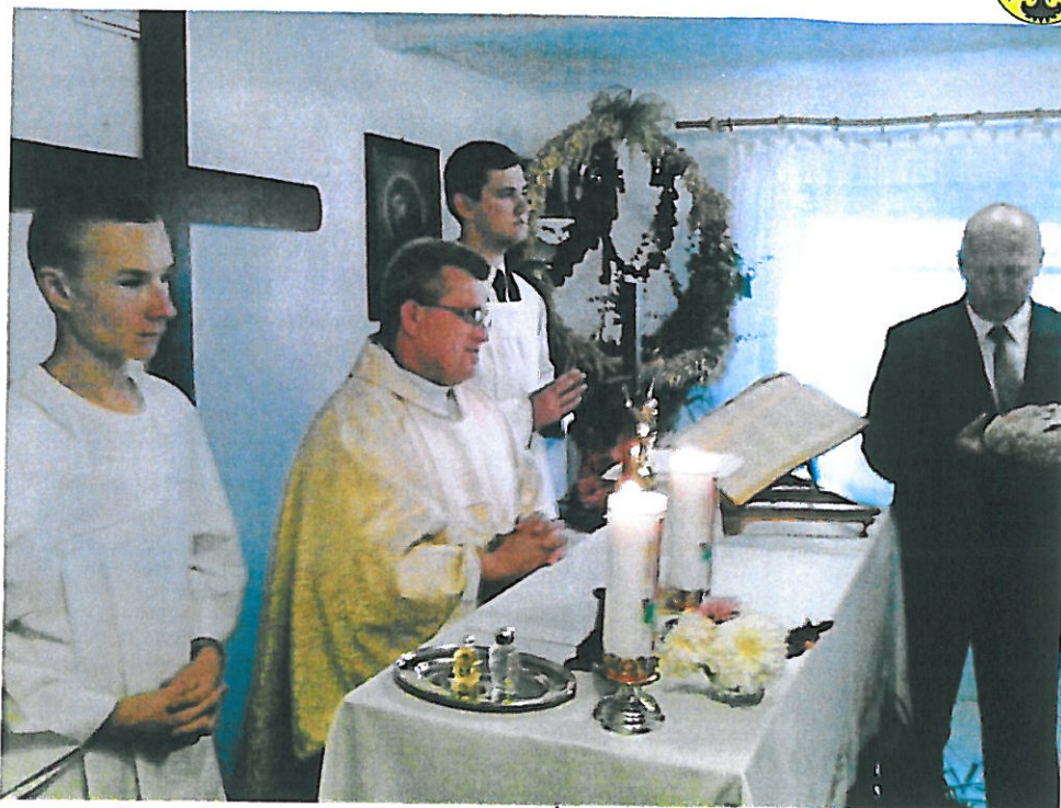
Dożynki wiejskie 2013r. Msza Św. w kaplicy przy świetlicy.