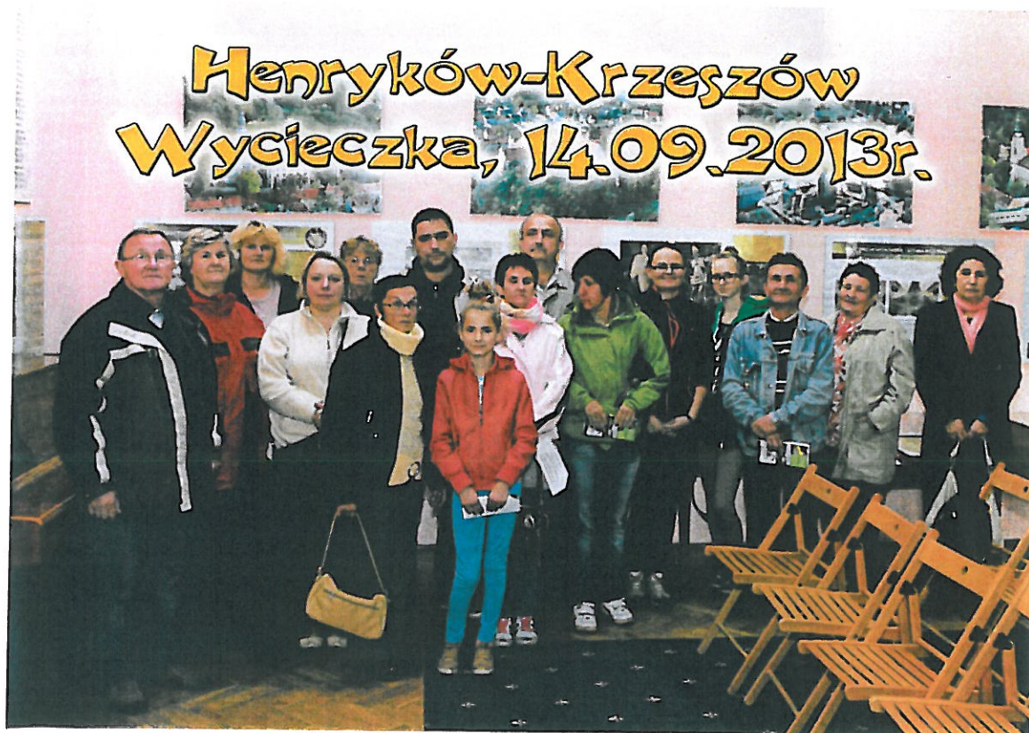
Wycieczka sfinansowana z funduszu sołeckiego