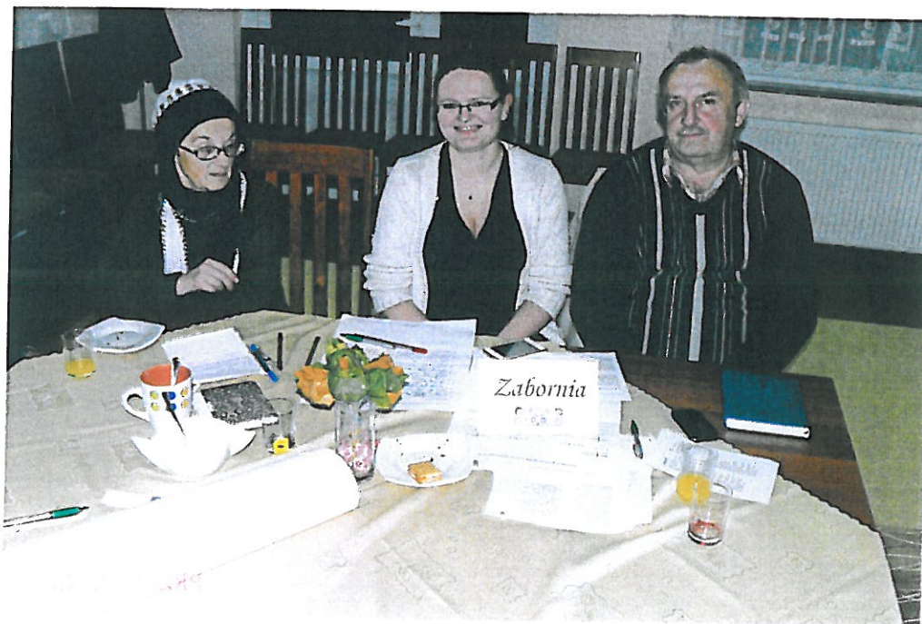
Warsztaty z odnowy wsi.