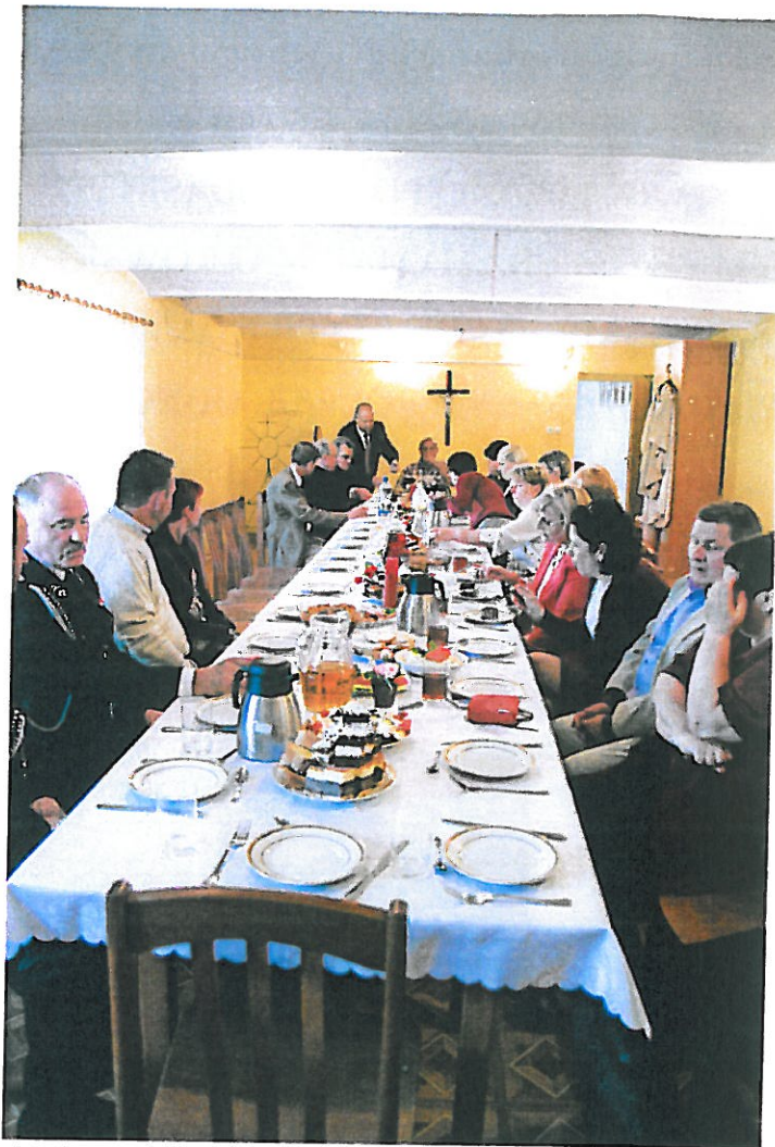
Odsłonięcie witacza. Uroczysty poczęstunek dla mieszkańców i zaproszonych gości.